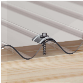
Bevestiging op de berg met schroeven en kalotten (ca. 10 p/m 2 )*

Meer informatie vindt u in de montagehandleiding onder "downloads".