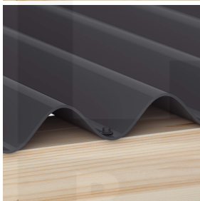
Optionale bevestiging in het dal met schroeven (ca. 6 p/m 2 )