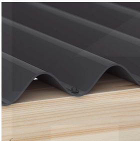
Bevestiging in het dal met schroeven (ca. 6 p/m 2 )

Meer informatie vindt u in de montagehandleiding onder "downloads".