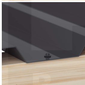
Optionale bevestiging in het dal met schroeven (ca. 6 p/m 2 )