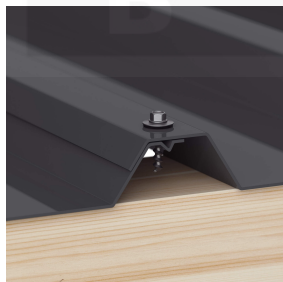
Overlappingsen worden altijd op de berg bevestigd (ca. 3 p/m 2 )