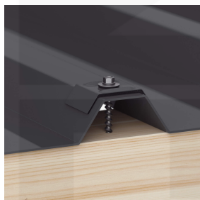
Bevestiging op de berg met kalotten en schroeven (ca. 6 p/m 2 )

Meer informatie vindt u in de montagehandleiding onder "downloads".