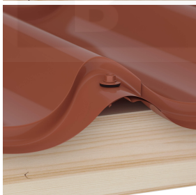
Overlappingsen worden altijd op de berg bevestigd (ca. 3 p/m 2 )