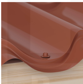
Bevestiging in het dal met schroeven (ca. 8 p/m 2 )

Meer informatie vindt u in de montagehandleiding onder "downloads".