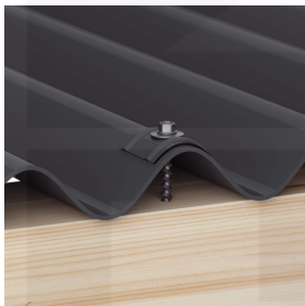
Bevestiging op de berg met kalotten en schroeven (ca. 6 p/m 2 )

Meer informatie vindt u in de montagehandleiding onder "downloads".