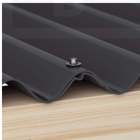
Overlappingsen worden altijd op de berg bevestigd (ca. 3 p/m 2 )